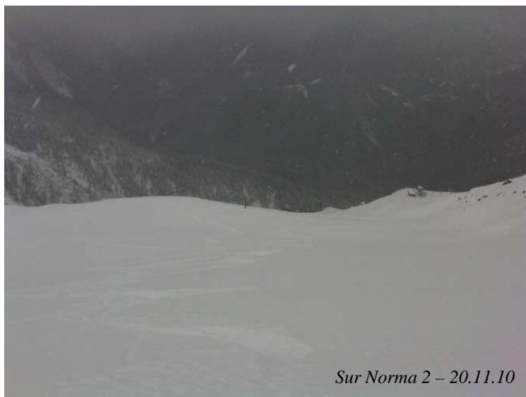
Sur Norma 2 – 20.11.10

Le modelage du haut de la piste de Norma 2 permet de garder la neige même par grand vent : on n'a pas touché un seul caillou en ce 11 novembre.