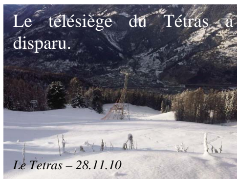
Le Tétrás – 28.11.10