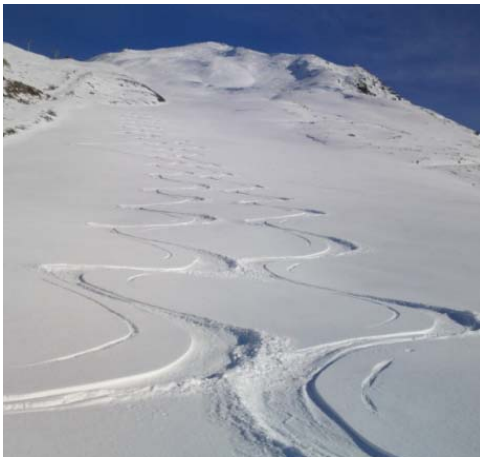
La piste de Norma 2 – 11.11.10

Et voilà, les premières neiges sont là, avec une bonne sous-couche en formation sur la piste de Norma 2 pour ce 11 Novembre.