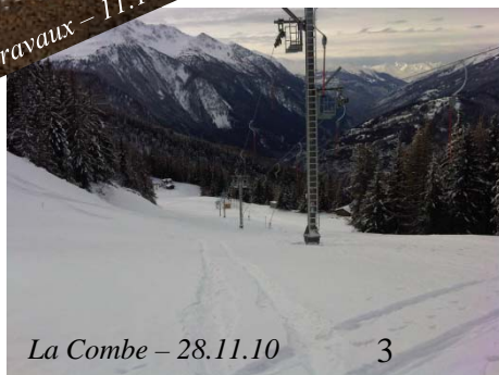
La Combe – 28.11.10